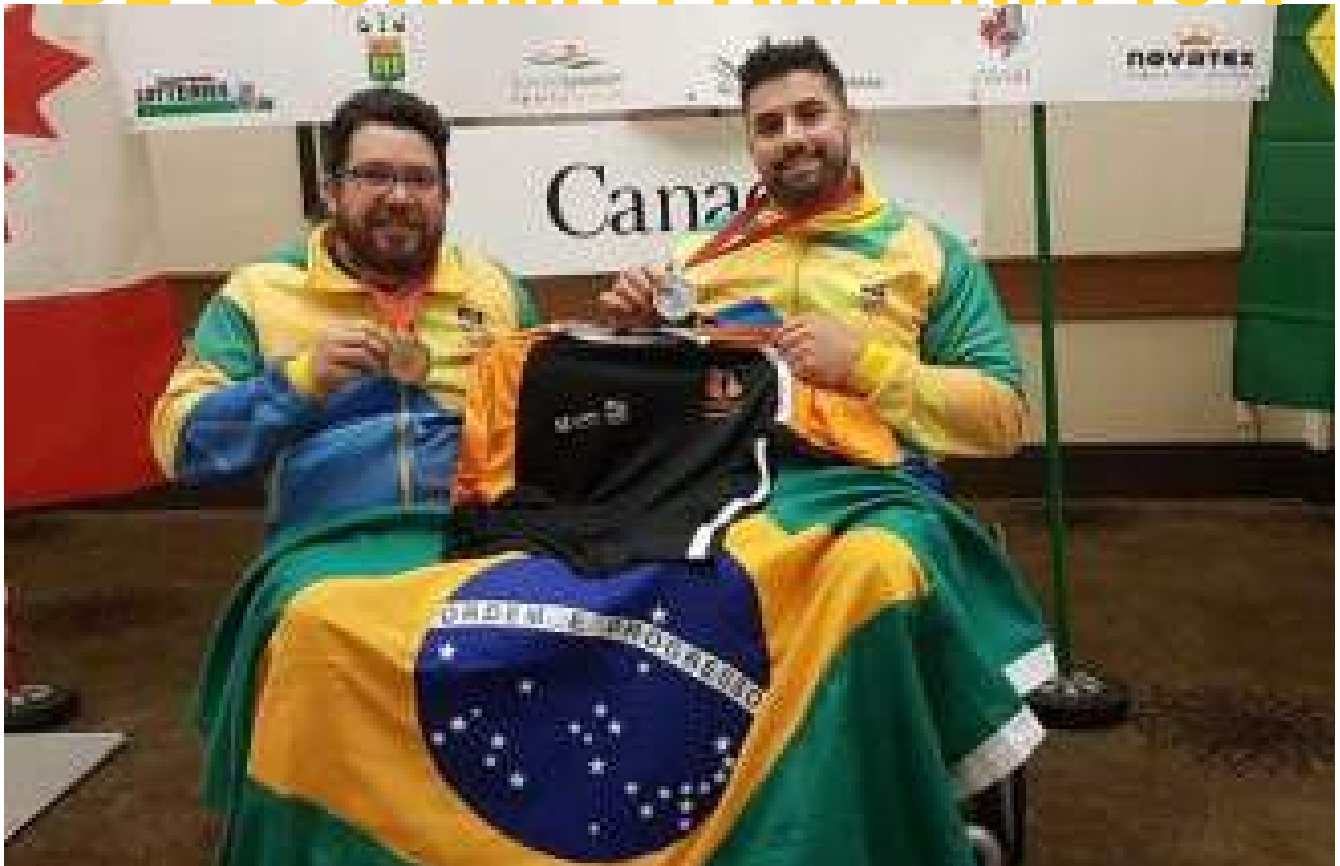
Paranaenses medalhistas de ouro na competição.